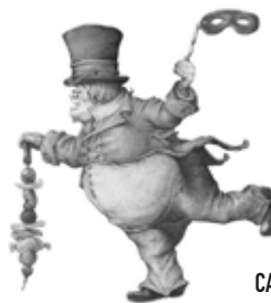
CABALLERO DE LA HORNILLA

Traza una línea entre el personaje y su objeto sin salirte del camino ni marearte.