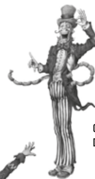
CONDE DE SALCHICHÓN