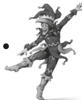
REY DE GALLOS