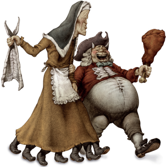
DON CARNAL Y DOÑA CUARESMA