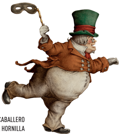
CABALLERO DE LA HORNILLA

Enseña al Caballero de la Hornilla cómo puede llegar hasta su bastón.